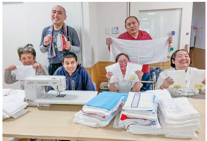
みなさんのご寄付により、定番製品の台ふきんが出来上がります。笑顔に感謝を込めて。(しいの木学園)