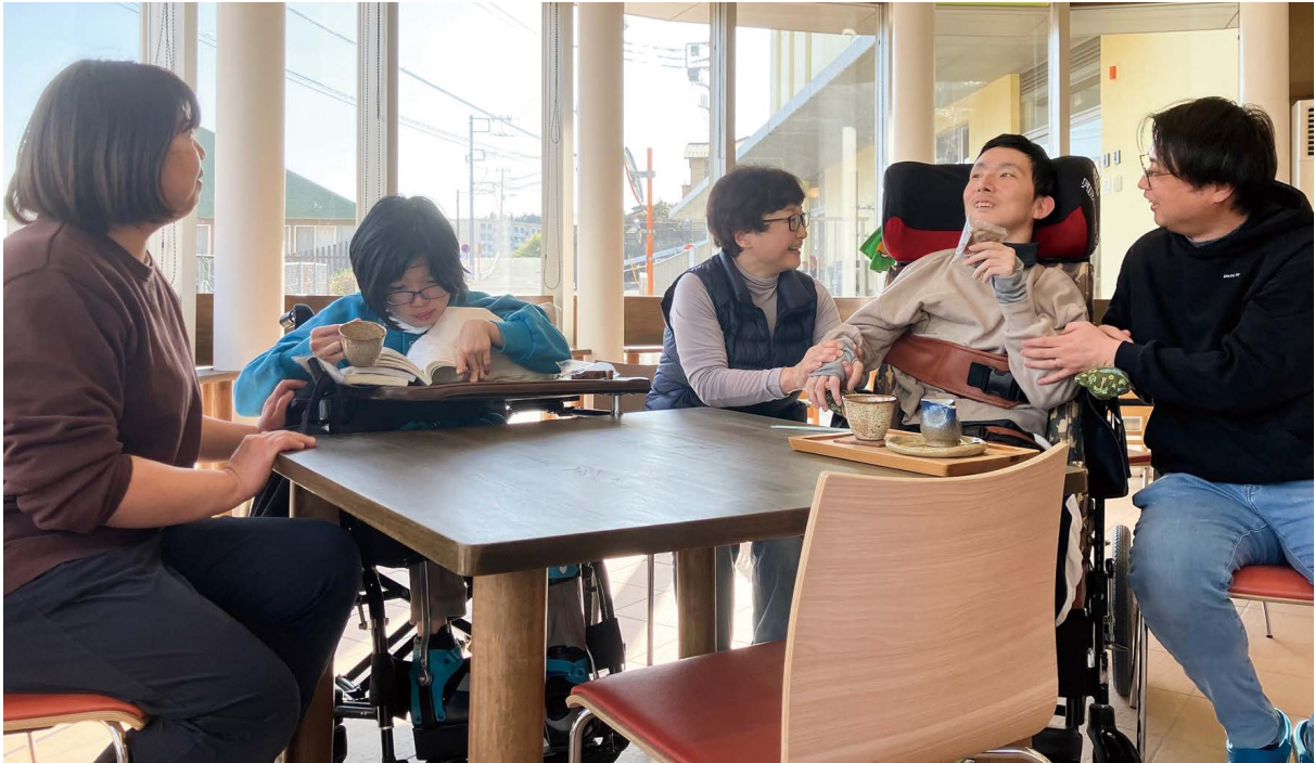
春の日差しに包まれて Okaeri café でひととき、午後の療育の個別時間を利用して仲間や職員、ボランティアさんとの何気ない会話に笑顔の輪が広がります。(太陽の家)

日上市助川町5-14-8 TEL(23)2620 FAX(33)9150 ホームページ http://www.taiyonoie.com Eメール npo@taiyonoie.com NPO法人 日立太陽の家 日立重症心身障害児(者)を守る会 日立太陽の家支える会