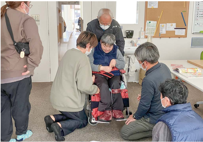
車椅子の修理、毎日使う車椅子だからよりよい仕上がりになるようにご家族やOT、PTも加わり丁寧に話し合います。(太陽の家)