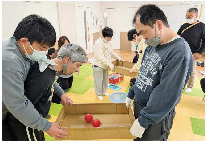
慎重に……中央の穴からボールを落とします。どのチームが一番早い？みんながんばれ～。(ひまわり学園)