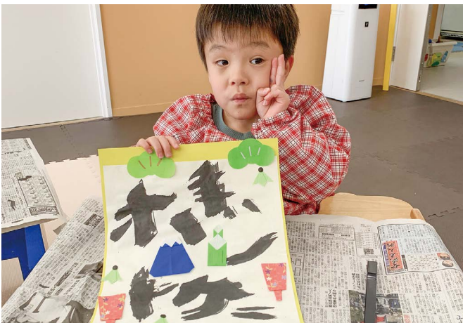
ボクの大好きな食べ物は、ホットケーキなの、今年もいっぱい食べたいな。(母子療育ホーム)